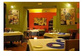
Enoteca La Torre Via Della Torre, 5 Viterbo Tel. 0761 226467 www.enotecalatorrevt.com