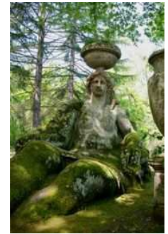
Giardini di Bomarzo