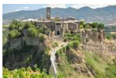
Civita di Bagnoregio