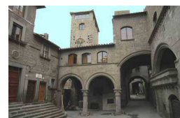
Quartiere San Pellegrino

Ore 15,30 Partenza in pullman per Bergamo con arrivo previsto alle ore 22,30 circa