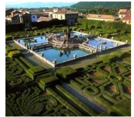
Villa Lante di Bagnaia