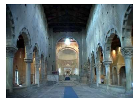
Chiesa di San Pietro