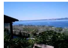
Vista dalla Trattoria "La Tana dell' Orso... Bruno" Località Monteseignale, 162 I - Bolsena Tel. 0761 798162-798730

Ore 20,30 Cena libera (per chi avrà ancora appetito)