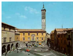
Piazza del Comune