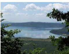
Lago di Vico

Ore 08,30 Partenza per la visita guidata di Caprarola e del suo bellissimo Palazzo Farnese e del lago di Vico