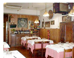
Trattoria Porta Romana Via Bontà, 12 Viterbo Tel. 0761 307118 www.trattoriaportaromana.viterbo.com

IL COSTO DELLA GITA PER PERSONA E' STATO CONTENUTO in € . 680,00IN CAMERA DOPPIA E MAGGIORAZIONE DI € . 80,00PER LA SINGOLA. IL NUMERO DEI PARTECIPANTI E' LIMITATO A UN MASSIMO DI TRENTA PERSONE.