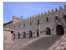
Palazzo dei Papi