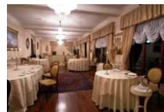
Ristorante "I Salotti"