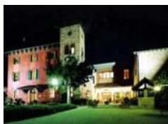
Hotel "Villa Il Patriarca" Strada Statale 146 Località Querce al Pino 53043 - Chiusi (SIENA) tel. +39 0578 274407 www.ilpatriarca.it