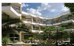
Mini Palace Hotel**** www.minipalacehotel.com

Ore 08,30 Partenza per la visita guidata di Civita di Bagnoregio, bellissimo borgo arroccato su un colle tufaceo che sembra sospeso tra la terra e il cielo. Luogo di nascita di San Bonaventura vi si accede oltrepassando un ponte lungo circa 300 mt. e percorribile solo a piedi. Al termine della visita partenza per la visita guidata del Lago di Bolsena.